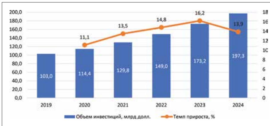
Рисунок 1 – Динамика глобальных инвестиций в умные города в 2019–2024 гг. (факт/прогноз), млрд долл.