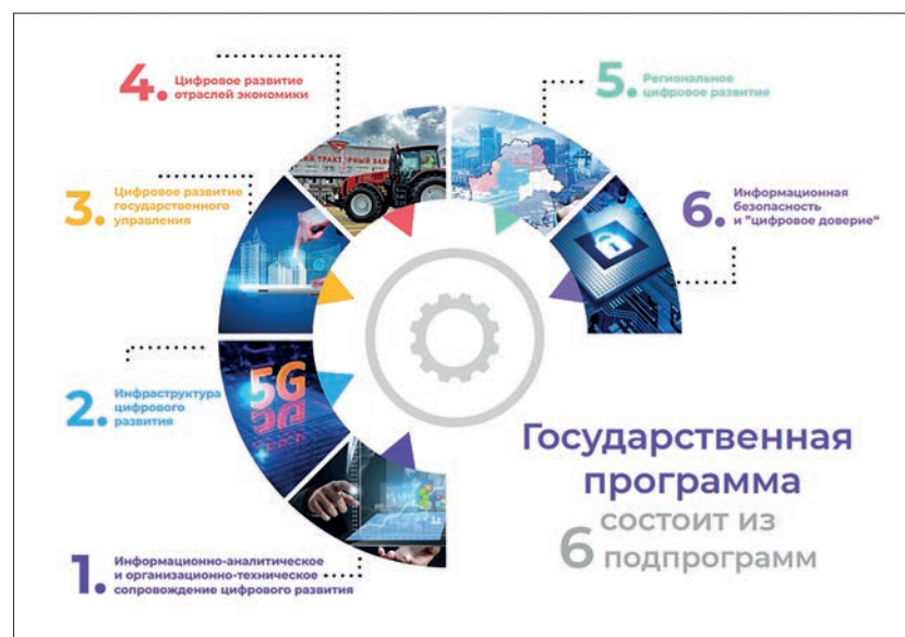
Рисунок 3 – Структура Государственной программы «Цифровое развитие Беларуси» на 2021–2025 годы

создание региональной государственной типовой цифровой платформы «Умный город (регион)», предназначенной для цифровой трансформации процессов регионального управления, решения задач социально-экономического и общественного