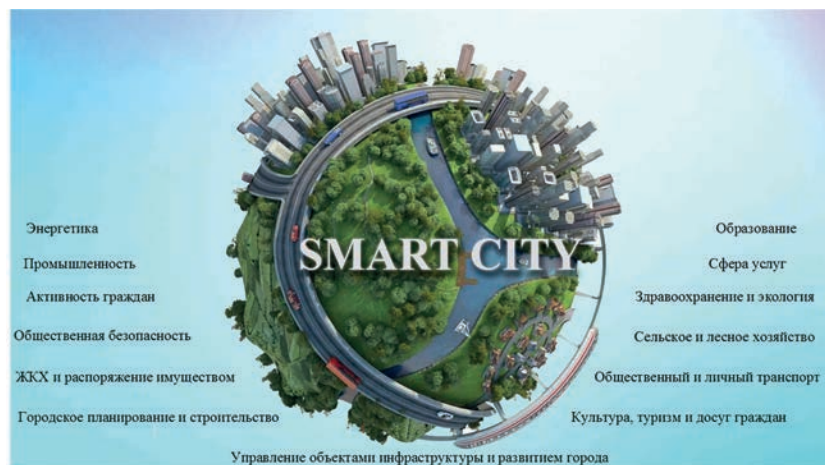
Рисунок 2 – Основные направления задач умного города

Внутренний контур цифровой платформы является информационно-аналитической системой управления городом (регионом) и доступен в формате как веб-портала, так и мобильного приложения. Он предназначен для использования уполномоченными сотрудниками координационного центра, администрации и подчиненных ей