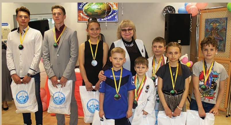
Председатель РК Белорусского профсоюза работников связи вместе с победителями конкурса

Также ребята приняли участие в активном квесте «Миссия выполнима».